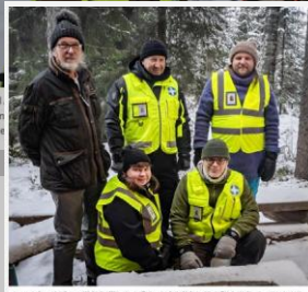
lan och sonen som dog i nare anslöt sig Aumo till

Kun ihminen katoaa, etsijät hälytetään paikalle tekstiviestillä – vapaaehtoiset kertovat, millaista etsintä on